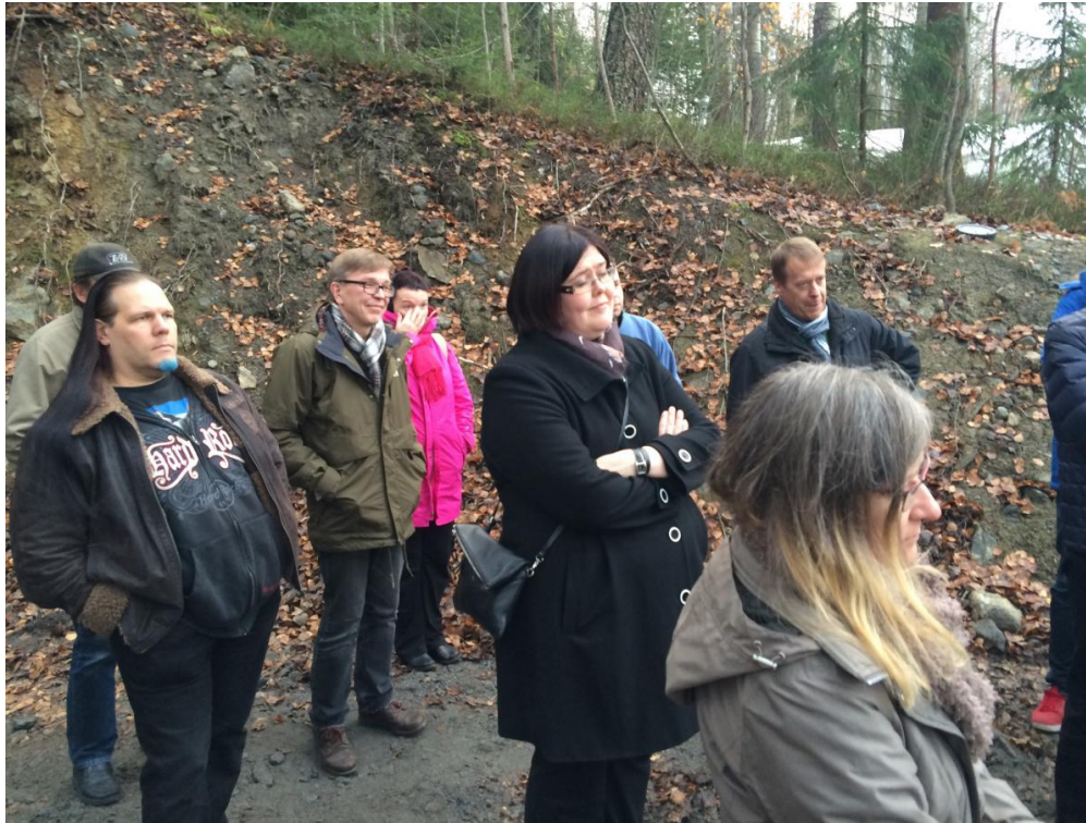
Kuva 4. Vierailijoita

Mielenkiinnolla jäämme odottamaan miten projekti etenee ja saavatko Skanskan rakentamat viereiset kerrostalot tulevaisuudessa käyttöönsä konesalista tulevaa hukkalämpöä.