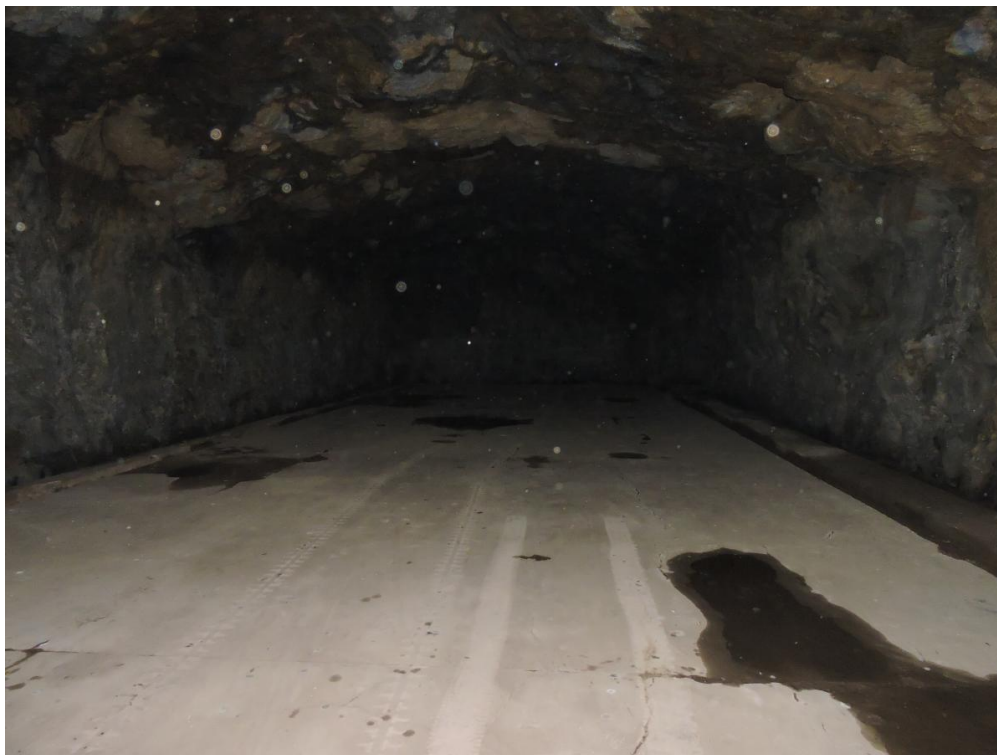
Kuva 3. Yksi luolista.

todisteena näytteiden oton jäljiltä lattiassa siellä tällä olevat tasaisen pyöreät reiät. Pimeää, kylmää ja kosteaahan tiloissa yhä on, mutta hengittämään pystyimme ja taskulamppujen valossa kiersimme luolaston kolme tunnelia läpi. Alla olevasta kuvasta ei erota tunnelin päässä olevaa aukkoa seuraavaan tunneliin sillä luolastossa oli todella pimeää.