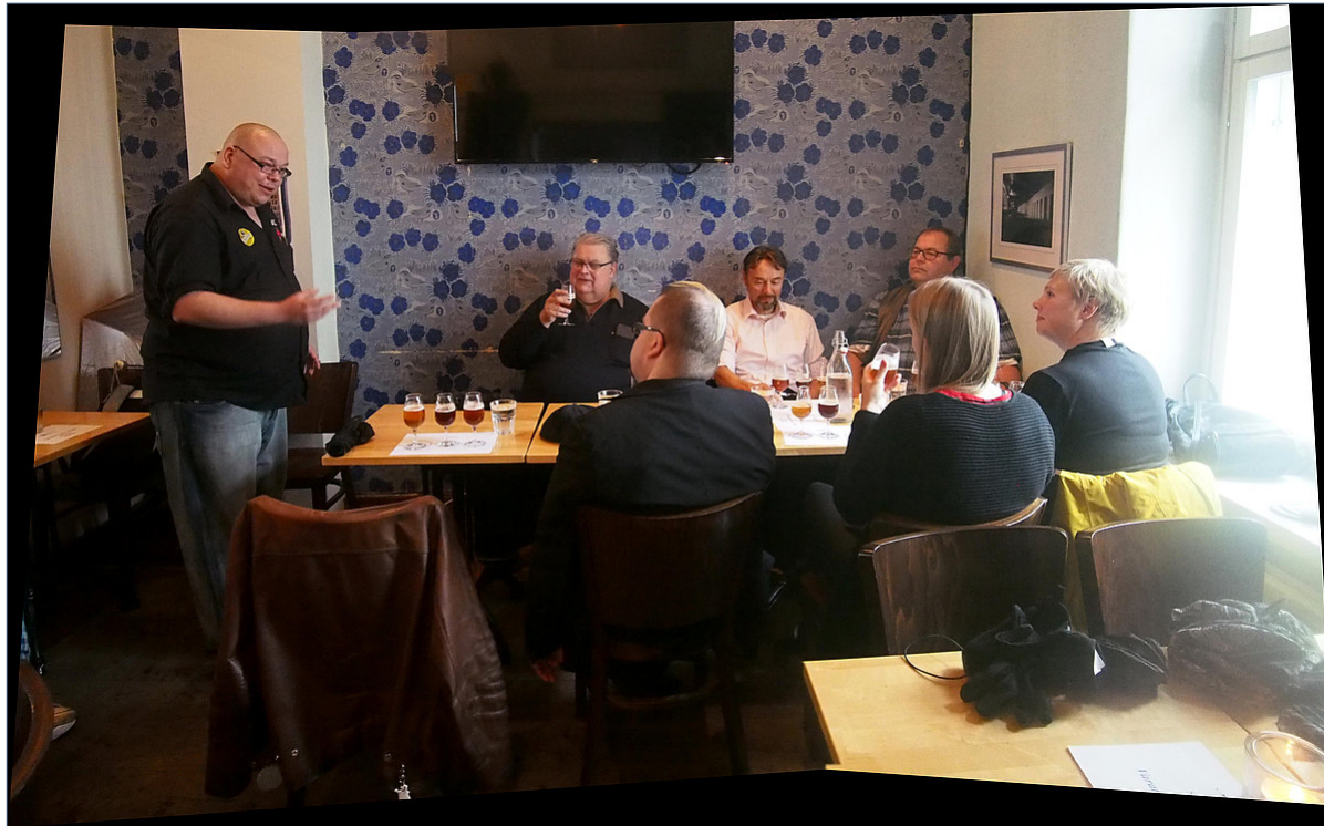
Puolimatkassa GastroPub Nordicissa maistelemassa oluita.